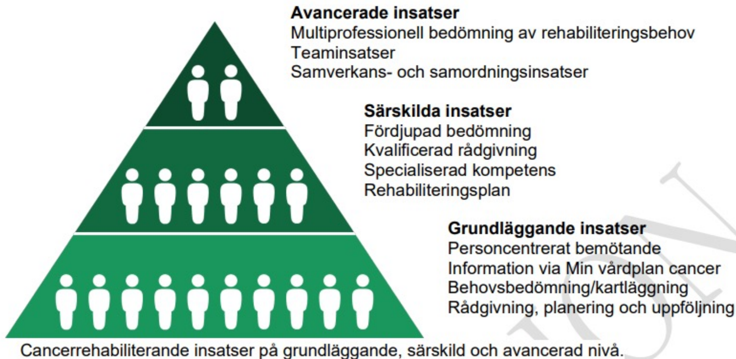
Figur 3. De tre nivåerna av insatser